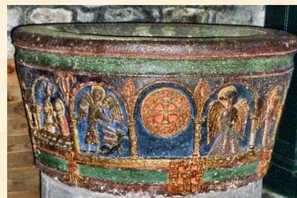
Cuve baptismale Mauriac

Acclament et chantent ta gloire, Alléluia x2